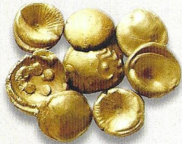
Keltische Goldmünzen (Regenbogenschüsselchen) 1. Jahrhundert v. Chr.