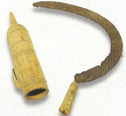
Hölzerner Kumpf und Sichel, 19. Jahrhundert