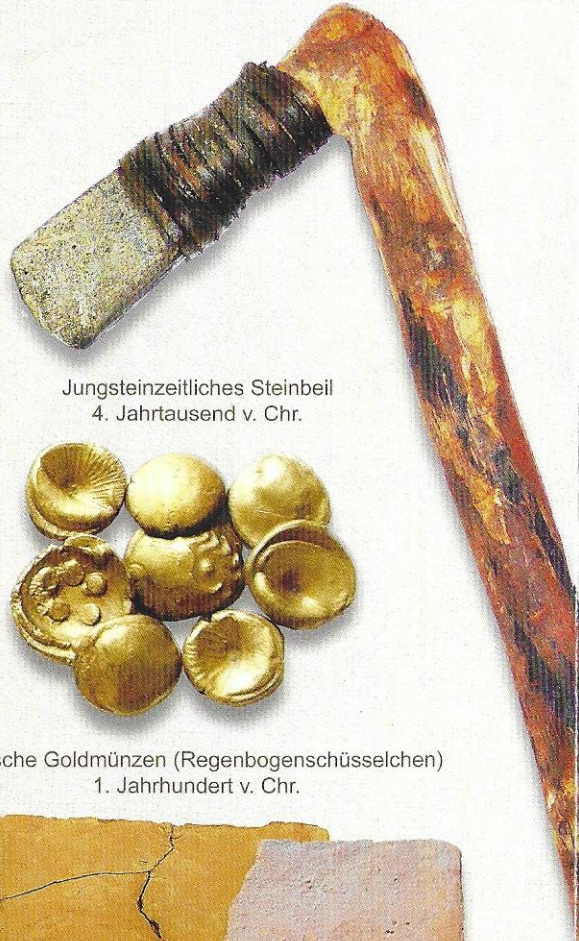
Jungsteinzeitliches Steinbeil 4. Jahrtausend v. Chr.

Archäologische Funde aus der Region und dem Landkreis Dachau