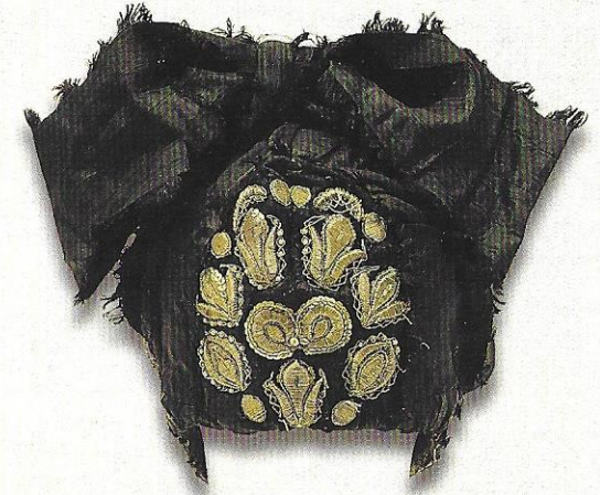
Haube zur Dachauer Tracht, 19. Jahrhundert