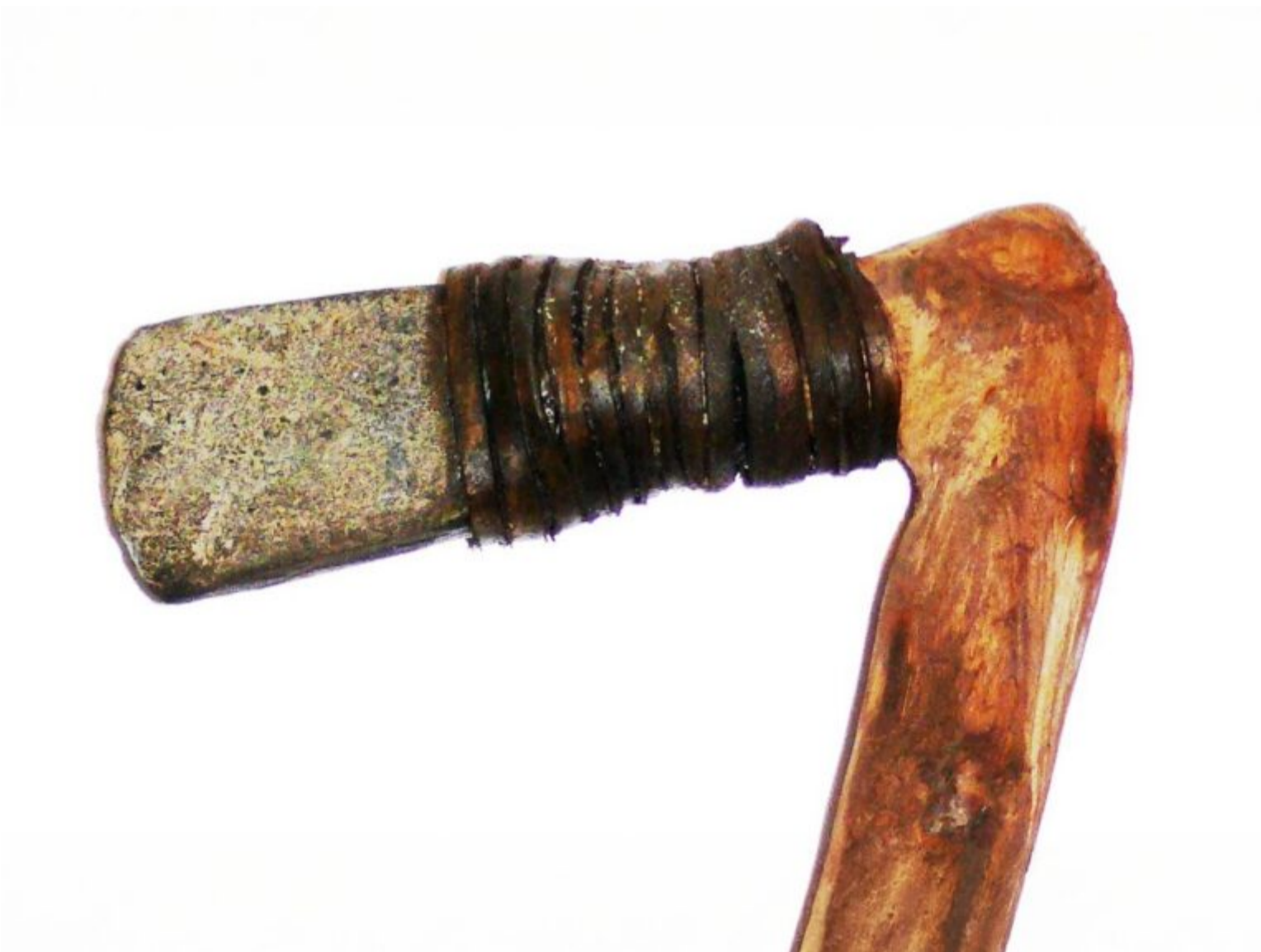
Die Steinklinge dieses

originalgetreu geschäfteten Steinbeils aus der Jungsteinzeit (4500 – 1800 v. Chr.) wurde in Bergkirchen