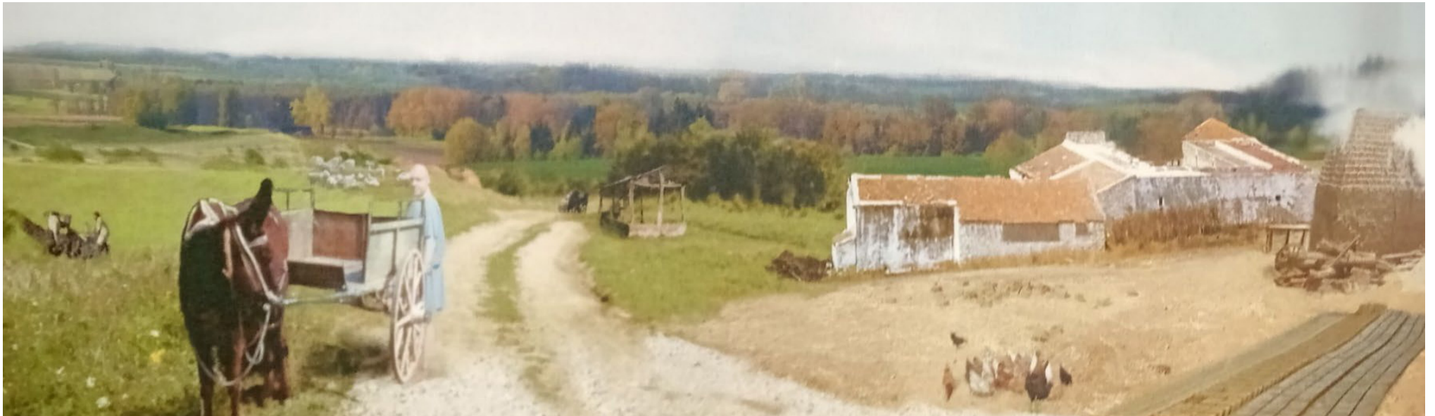
Blick von Südosten auf die „Villa rustica“ von Großberghofen – Rekonstruktionsdarstellung von H.-P. Volpert

Bereits 1921 sind Reste dieses vermutlich bedeutendsten römischen Gutshofs im Landkreis Dachau, aus dem 3. – 4. Jhd. n. Chr., durch den Museumsverein Dachau ausgegraben worden. Damals wurden die Grundrisse von fünf Gebäuden (darunter ein Wohnhaus und ein Badehaus) aufgedeckt. Nahezu vollständig geborgene, rechteckige Hohlziegel (Tubuli – siehe Fundstücke) lassen darauf schließen, dass Boden und Wände zumindest in Teilbereichen der Villa rustica durch künstlich erwärmte Luft gleichmäßig beheizt wurden. Die Römer waren damit ihrer Zeit weit voraus. Es dauerte bis in die 70er Jahre des 20. Jahrhunderts bis die Annehmlichkeiten einer Wand- und Fußbodenheizung in unsere Wohnwelten zurückkehrten. Neben kunstvollen Glasgefäßen, wie dem bei Großberghofen entdeckten Kännchen, stellten die Römer bereits Flachglas für die Fenster ihrer Gebäude her. Diese Fertigkeit ging in der Völkerwanderungszeit wieder verloren.