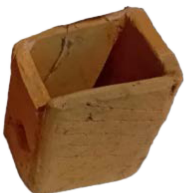
Typischer und gut erhaltener Hohlziegel (tubulus) einer römischen Wandheizung